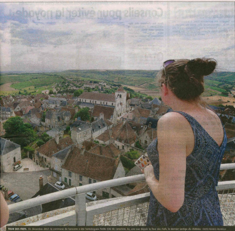
TOUR DES FIEFS. En décembre 2017, le commando de Sancerre a été homologué Petite Cité de caractère. Ici, une rue depuis le Tour des Fiefs, le dernier vestige du château.