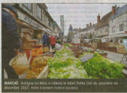
MARCHÉ. Aubigny-sur-Nère a obtenu le label Petite Cité de caractère en décembre 2017.

Midi. Cocktail déjeunatoire dans la cave municipale. 1 rue de la Croix-de-Bets à Sancerre.