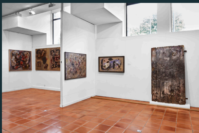
Salle d'exposition Jean Villeri, le méditerranéen