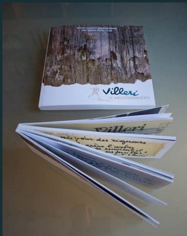
© Catalogue Jean Villeri, le méditerranéen