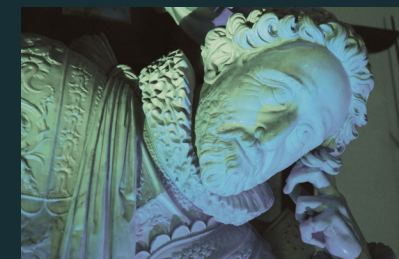
Le manoir de Lesdiguières (détail)

Public : en famille (enfants dès 6 ans) Sur réservation (voir p. 2)