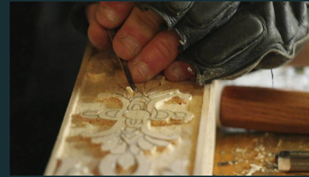
© Mmd05 - ACR - Valérie Verger, ébéniste d'art