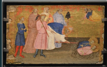
© Saint Ambroise découvrant les corps de saint Gervais et de saint Protas - XIVe siècle - Ecole italienne

Restaurateur et ébéniste d'art... des métiers révélateurs de l'essence d'une oeuvre.