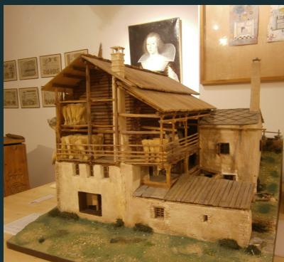
La maison du Soum à Saint Vêran (maquette)

Public : en famille (enfants dès 6 ans) Sur réservation (voir p. 2)